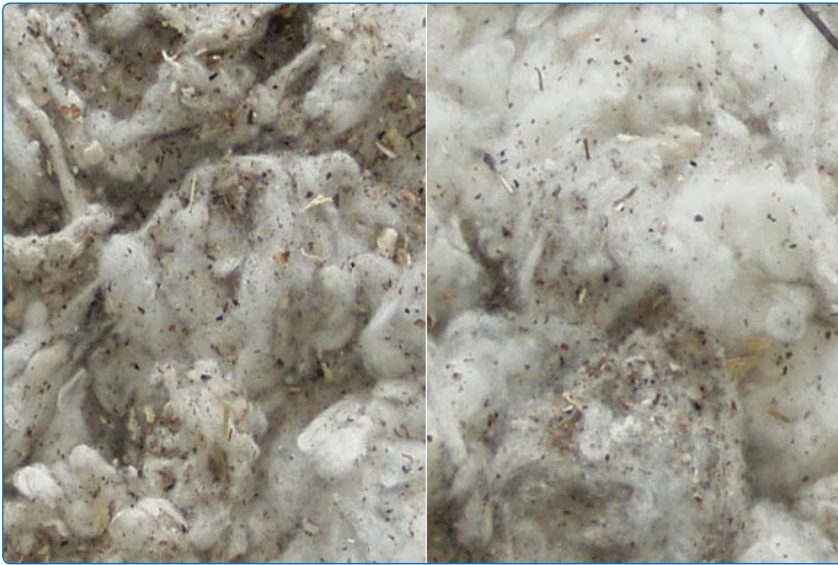
Abfall ohne WASTECONTROL